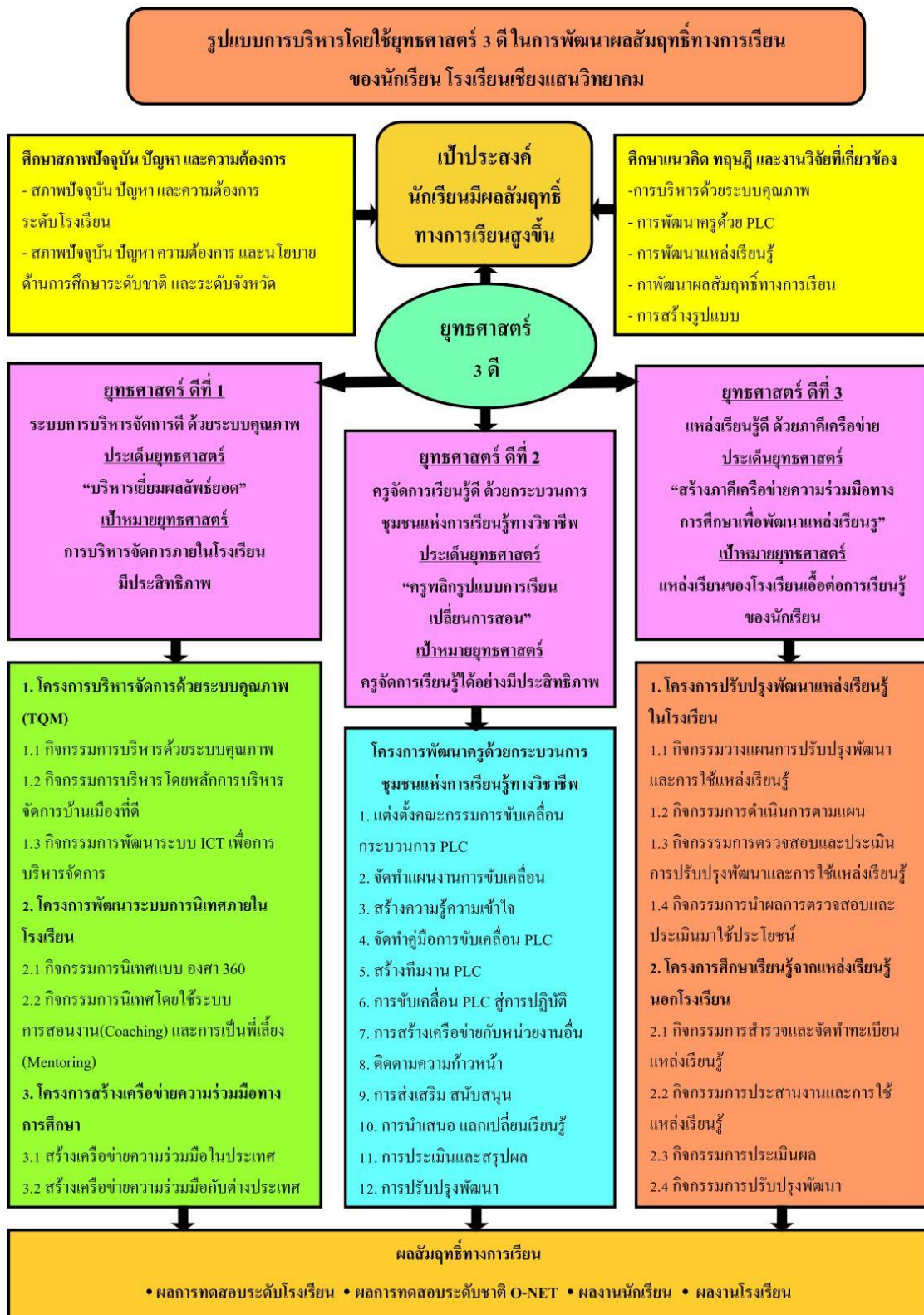
ภาพที่ 4.3 รูปแบบบริหาร โดยใช้ยุทธศาสตร์ 3 ดี ในการพัฒนาผลสัมฤทธิ์ทางการเรียนของนักเรียน โรงเรียนเชียงแสนวิทยาคม