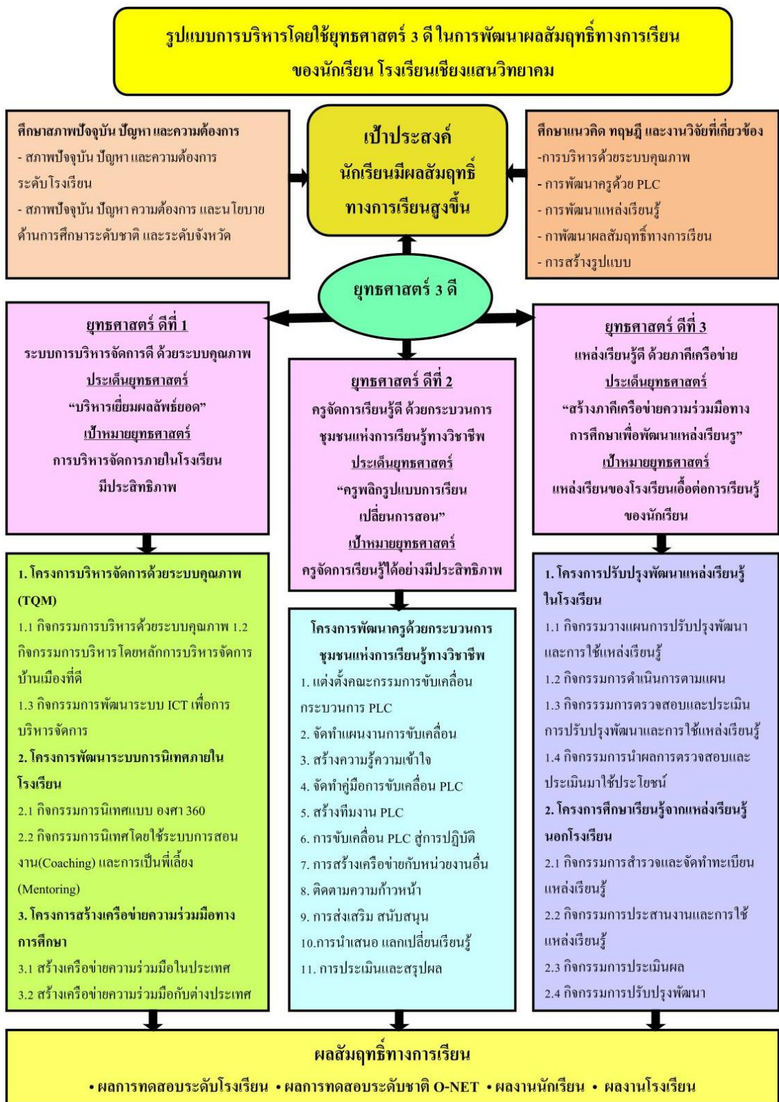
ภาพที่ 4.2 ต้นฉบับรูปแบบการบริหารโดยใช้ยุทธศาสตร์ 3 ดีในการพัฒนาผลสัมฤทธิ์ทางการเรียนของนักเรียน โรงเรียนเชียงแสนวิทยาคม